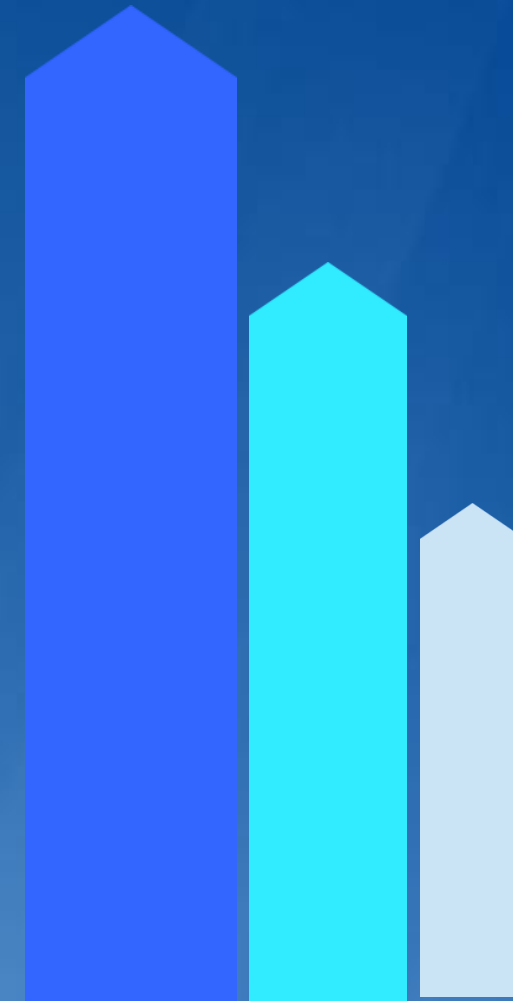
אשכול תנועה וניידות