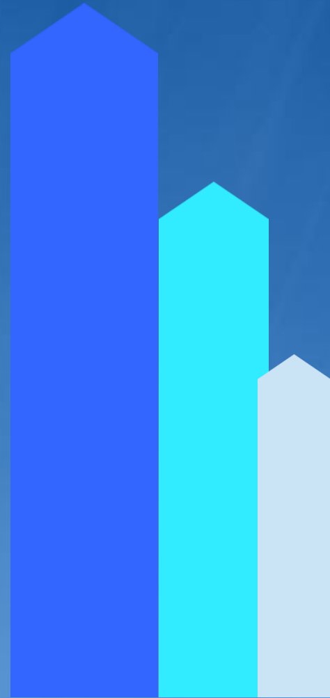
אשכול תקשורת, יחסים, למידה ועיסוקים