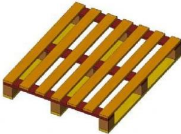
משטח קוביות 120x100 כללי