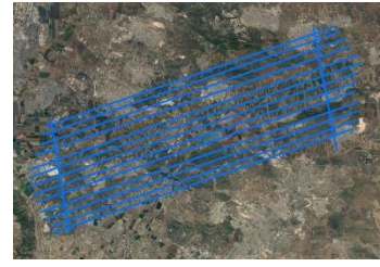
איור 1: קווי סריקה ארוכים מ 25 ק"מ, שני קווי קשירה בקצות הבלוק מעל שטחים בנויים החוצה את כל הקווים.

5.10 על מערכת סורק הלייזר לאסוף, כמינימום, שלושה נתוני החזר (ראשון, ביניים ואחרון) ונתוני עוצמה לכל החזר. מספר מרובה יותר של החזרים או קליטת הגל המוחזר כולו מהוות תוספת רצויה.