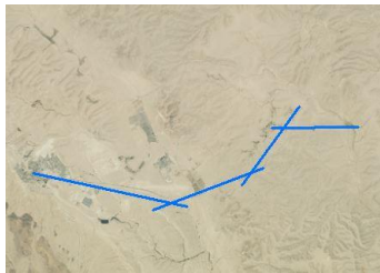
איור 3: פרויקט סריקה קווי, קווי הסריקה חוצים אחד את השני מעל שטחים בנויים.